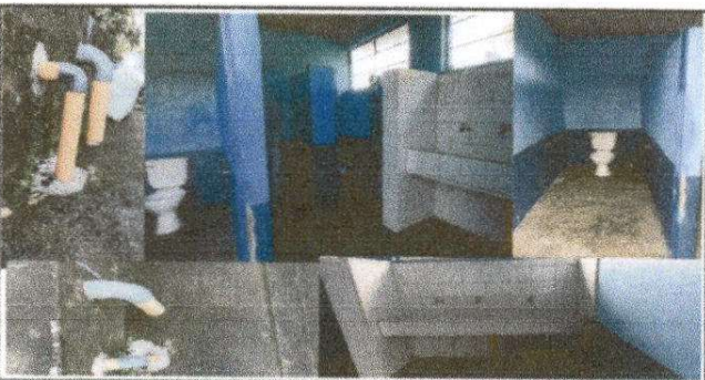
FOTO: 5 SANITARIO DE DAMAS. Sustitución de inodoros (tazas), lavamos, piso, drenaje, vidrios, depósito de agua, mantenimiento de puertas.