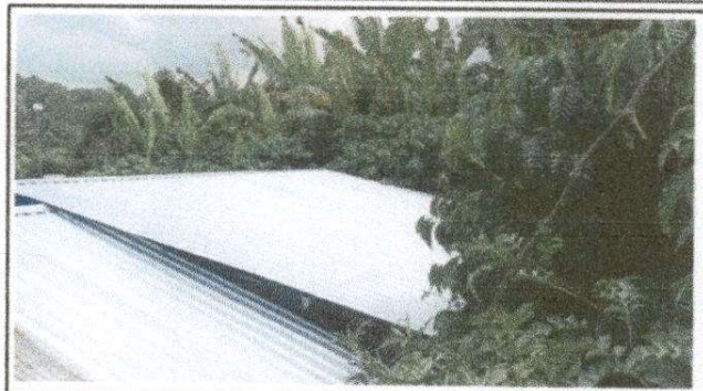
FOTO: 2 CUBIERTA DE LAMINA. Módulo 2 Aula 1