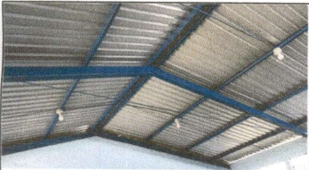
FOTO:3 REPARACION DEL SISTEMA ELECTRICO. Aula 1 Módulo 2