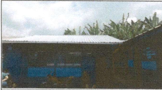
FOTO: 1 CUBIERTA DE LAMINA. Módulo 1 Aula 1