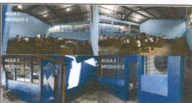
FOTO: 6 MODULOS DE AULAS 1Y 2. Pintura de interiores y exteriores.

Observación: Si es necesario se pueden agregar hojas adicionales actualizando el número de hojas.